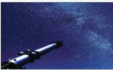
सिंगल-विंडो सुविधा उपलब्ध कराने के लिए एक सर्मापित सुविधा प्रकोष्ठ भी स्थापित किया जाएगा। स्पेस टेक नीति से मध्य प्रदेश देश के अग्रणी टियर-2 स्पेस टेक हब के रूप में उभरेगा।

भारतीय अंतरिक्ष नीति व इन स्पेस सुधारों के अनुरूप निजी क्षेत्र की भागीदारी को बढ़ावा: सीएम